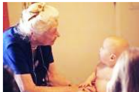
ロルフィングの創始者アイダ・ロルフ博士